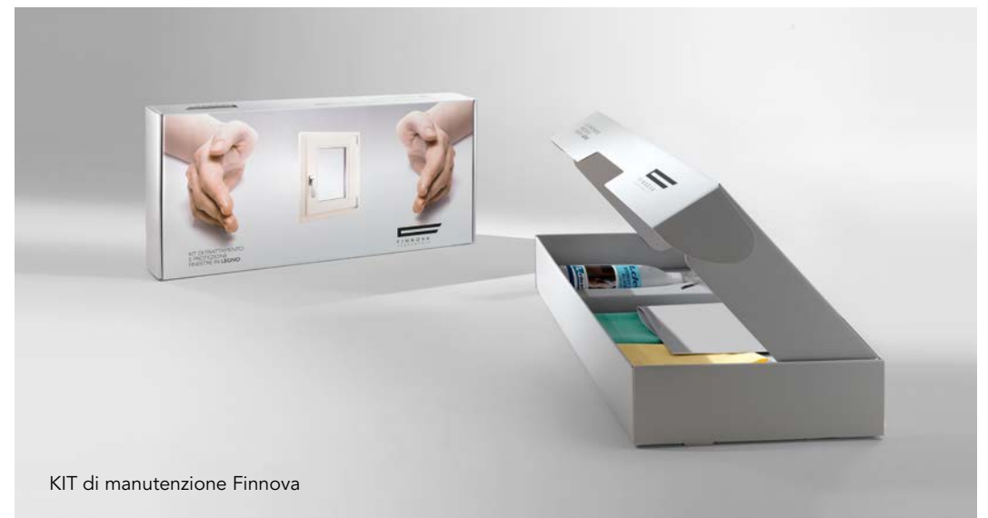
KIT di manutenzione Finnova

Evitare assolutamente l'uso di prodotti contenenti alcool e ammoniacca e/o solventi aggressivi che danneggerebbero la superficie del legno verniciato.